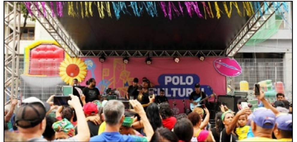
A avenida entra no clima da maior festa popular da capital pernambucana, o Carnaval, prometendo muito frevo no pé e animação

O Polo Esportivo contará com os tradicionais basquete de rua, vôlei de rua, futsal e patinação. Quem passar no polo PET poderá escolher um amigo de quatro patas para adotar e fazer parte da família, com o