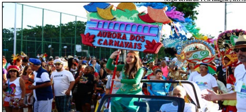
Eventos acontecem em Boa Viagem e Rua da Aurora, respectivamente; toda a programação está disponível em carnavaldorecife.com

da garantia da presença dessas pessoas em todos os espaços e festividades.