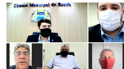
O PLE nº 05/2021 teve parecer pela aprovação

O projeto de lei nº 05/2021 ratifica o protocolo de intenções firmado entre municípios de todas as regiões do país para a constituição do Consórcio Nacional de Vacinas das Cidades Brasileiras (Conectar). A finalidade é a aquisição de vacinas para combate à pandemia do coronavírus, além de medicamentos, insumos, equipamentos e serviços na área da saúde.