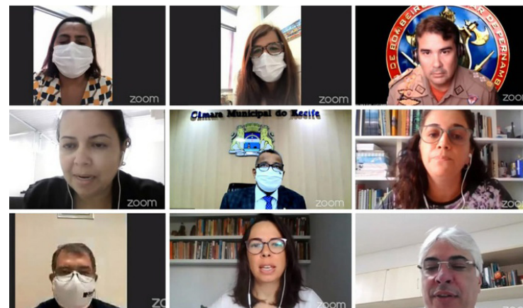
Câmara promove audiência pública para debater o assunto com diversos órgãos