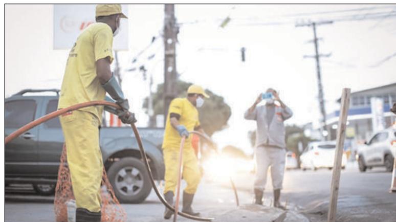
Prefeito acompanhou o trabalho de equipes da Emlurb que realizaram intervenções de poda, limpeza e reparos em vários bairros do Recife

Já no bairro da Várzea, João Campos vistoriou serviços de recuperação asfáltica, que visam a eliminação de buracos nas vias públicas. O prefeito acompanhou ainda uma intervenção de desobstrução da rede de drenagem com caminhão de sucção na Avenida General San Martin, no bairro do Cordeiro. Além dessas intervenções visitadas pelo prefeito, a Emlurb está realizando serviços de limpeza de canais, podas, desobstrução de galerias e canaletas e reparos na drenagem e pavimentação de diversos outros pontos da cidade durante todo o final de semana, contando com o trabalho de mais de 200 pessoas.