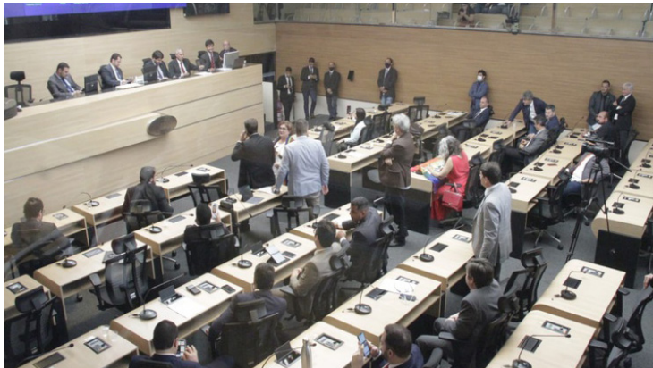
Vereadores aprovaram de forma unânime o Auxílio Emergencial e o Auxílio-Moradia para as pessoas vítimas das chuvas