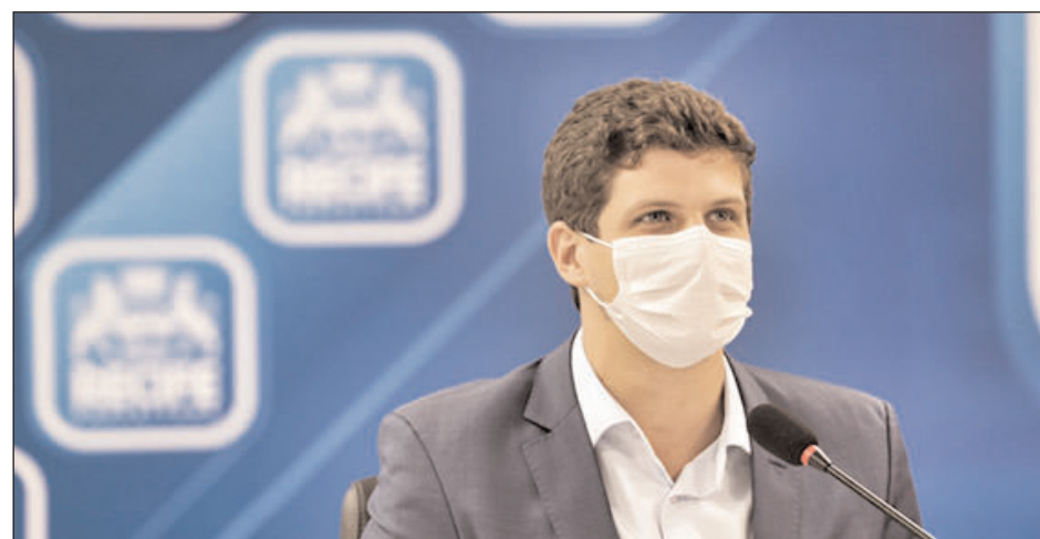
O prefeito João Campos, a partir da publicação no Diário Oficial da quinta-feira (15), assina o decreto que estabelece o marco legal da Estratégia de Transformação Digital do Recife

Dentre os princípios norteadores que fazem parte da estratégia da transformação digital está a desburocratização do acesso aos serviços. Faz parte desse conjunto de mudanças a modernização, o fortalecimento e a simplificação da relação entre o poder público municipal e o cidadão, a partir de serviços digitais de linguagem de fácil entendimento disponíveis, inclusive, por meio de dispositivos móveis.