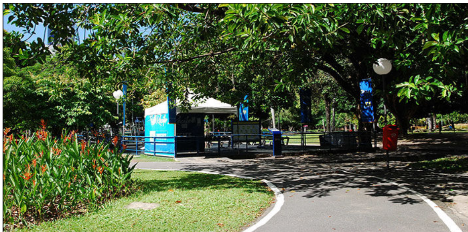
Nova carteira da Prefeitura contempla concessões de parques urbanos, como o da Jaqueira