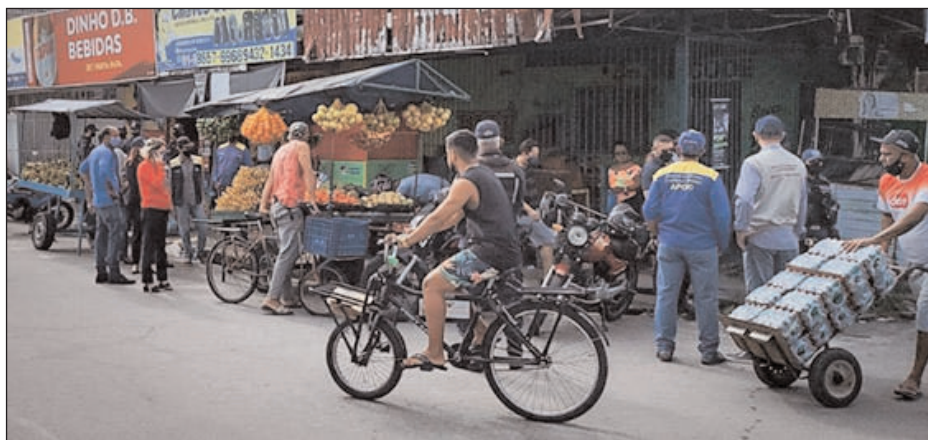
Ação teve caráter educativo e visou facilitar o tráfego de pedestres e veículos

A Secretaria Executiva de Controle Urbano e a Autarquia de Serviços Urbanos (Csurb) realizaram, na semana passada, uma ação de ordenamento na área do entorno do Mercado de Água Fria. O objetivo foi aumentar a mobilidade de pedestres e veículos no local, alvo de reclamações devido a ocupações irregulares de