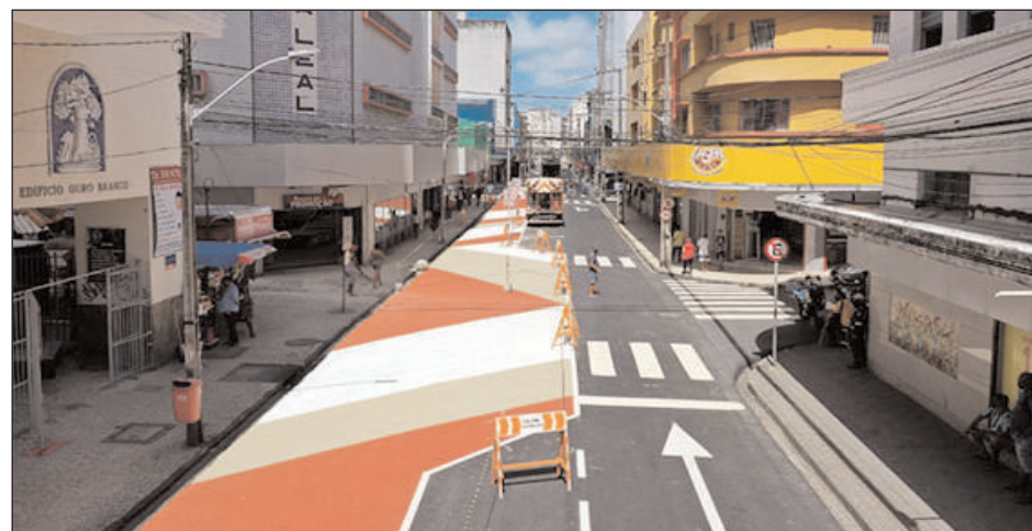
Na Rua da Palma, no bairro de Santo Antônio, urbanismo tático foi implantado e ampliou área para circulação dos pedestres, invertendo a divisão do espaço da via

Com uso de urbanismo tático, as equipes técnicas realizam projetos para solucionar problemas dos desenhos viários. No caso da