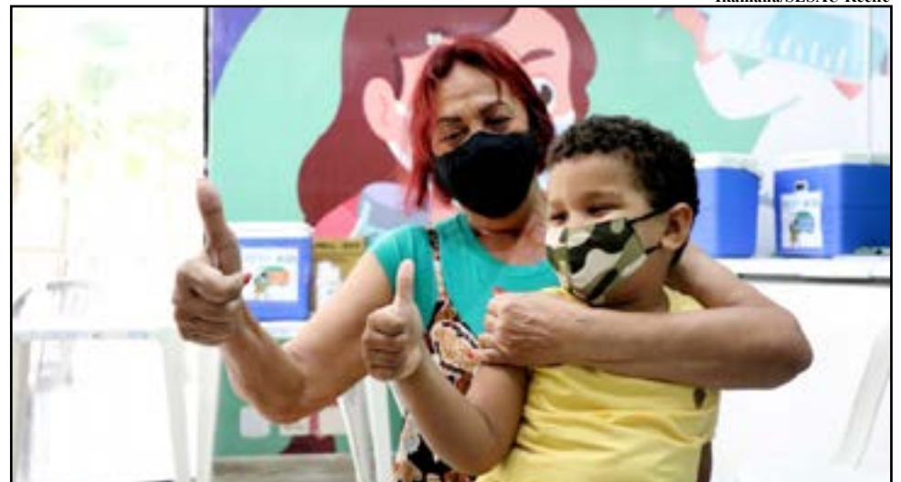
Município também fará ações de imunização contra a poliomielite para crianças de um a menores de cinco anos

BAIXAS COBERTURAS - Para se ter ideia de como as coberturas vacinais estão baixas, a série histórica dos últimos cinco anos de alguns imunizantes do calen-