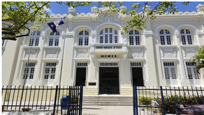
Acompanhe as notícias da Casa de José Mariano

A Câmara Municipal do Recife retomou nesta segunda-feira (16) a publicação de notícias no site ( www.recife.pe.leg.br ) e nas redes sociais da Casa. Desde o dia 15 de agosto essas atividades foram suspensas, em cumprimento à Lei Federal número 9.504/1997 (Lei das Eleições). No entanto, as vereadoras e os vereadores da capital pernambucana continuaram a promover reuniões Ordinárias e Extraordinárias, além de reuniões de Comissões e audiências públicas - transmitidas no site, ao vivo, por videoconferência.