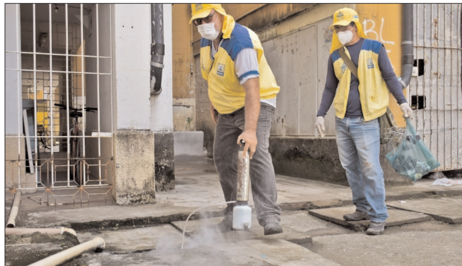
Em cada um dos dias, os asaces farão 500 visitas em cada bairro

vacinação antirrábica de cães e gatos para a Capela de São Francisco de Assis, que fica na Rua Dr. Dirceu Velloso Toscano de Brito, 122, Jardim Beira Rio, no bairro do Pina. A expectativa é que sejam vacinados 300 animais.