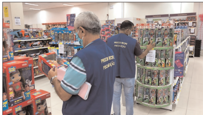
Equipe percorreu dois grandes shoppings na capital pernambucana e visitou 15 lojas que comercializavam produtos e prestavam serviços para crianças

grounds) e observou o cumprimento das legislações de acessibilidade do deficiente. Além disso, também foram verificados aspectos relativos à segurança dos brinquedos, como determina o Inmetro, e, no caso dos playgrounds, conforme preceitua a Lei estadual 16559/19.