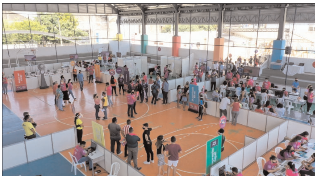
A primeira edição foi no Compaz Dom Helder Câmara

realizador do Arena Go. A participação do Sesc se concentrará em transferência da tecnologia social, por meio do repasse de sua metodologia diferenciada para diálogo com a comunidade local, articulação com rede de empresas e instituições parceiras, definição dos espaços e serviços ofertados, organização do fluxo de atendimento ao público.