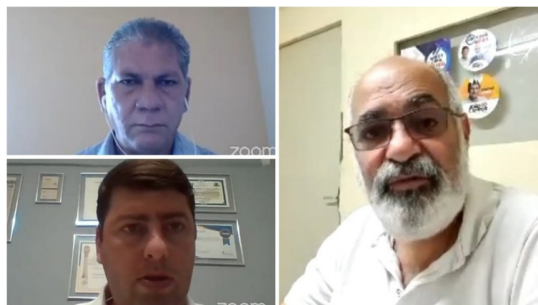
Comissão de Legislação aprovou sete proposições