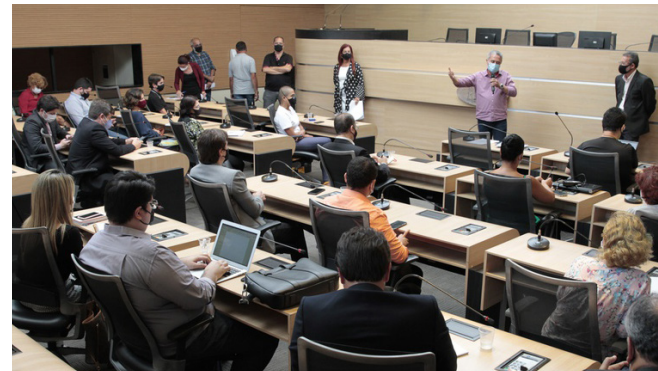
Gestores explicaram o funcionamento da Câmara Municipal

Cidadão do Recife, Medalha de Mérito José Mariano, entre outros.