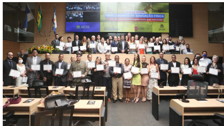
Profissionais de educação física são homenageados