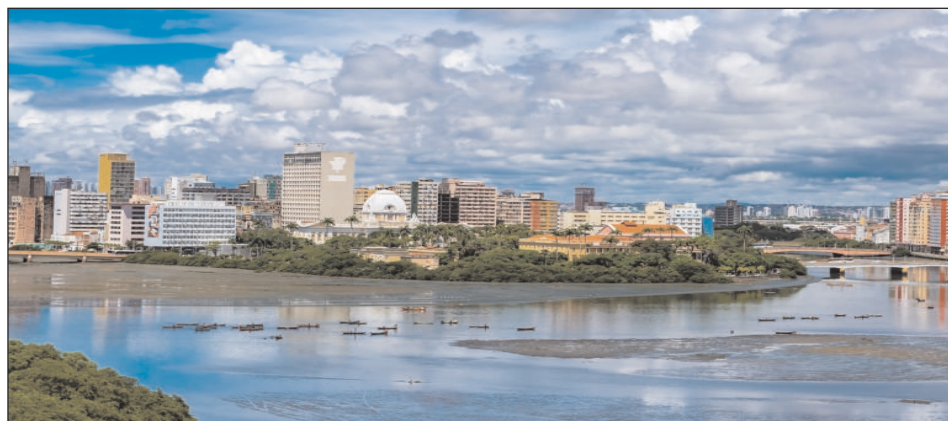
Capital pernambucana é referência no Nordeste no setor de Serviços

burocratizar processos, melhorar o ambiente de negócios e ampliar os investimentos públicos, que oferecem mais serviços para a população, ao mesmo tempo em que geram emprego e renda. E toda essa agenda é permeada por um amplo processo de transformação digital da gestão", avalia o gestor.