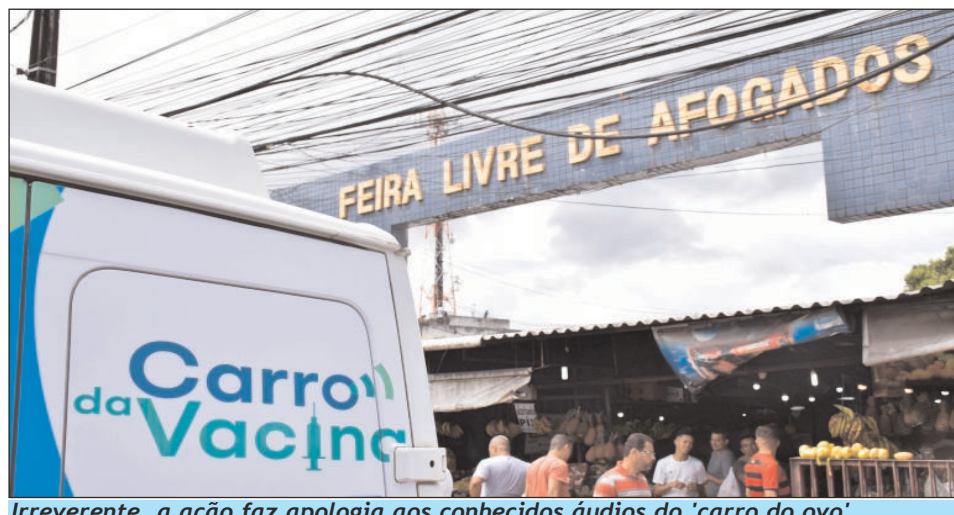
Irreverente, a ação faz apologia aos conhecidos áudios do 'carro do ovo'

sábado (20), na Feira Nova de Afogados, na Zona Oeste da cidade.