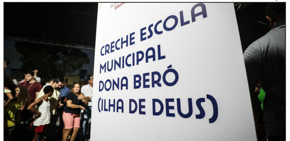
Creche Escola Municipal Dona Beró vai atender cerca de 110 crianças da região

“Atendendo a um compromisso do prefeito João Campos, a gente vem trabalhando, ao longo do tempo, para poder