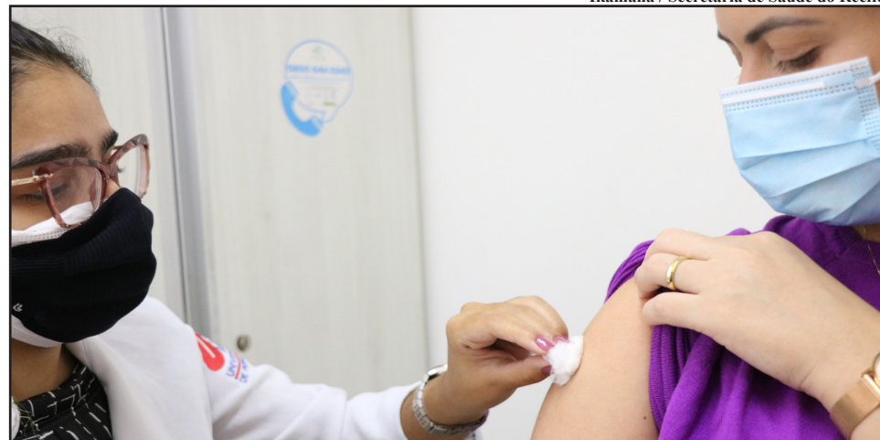
Em todos os locais haverá vacinação contra covid-19. Além disso, em alguns pontos também terá disponibilidade de vacina contra gripe e atualização do cartão de vacinação

Confira a programação no www.recife.pe.gov.br .