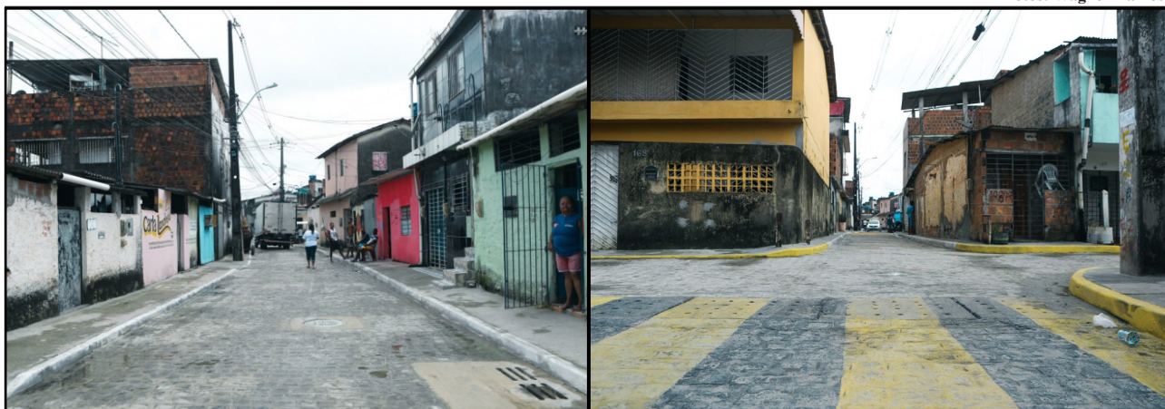
A Rua da CUT, no Caçote, recebeu a implantação de pavimentação, drenagem e melhoria das calçadas

A Rua da CUT recebeu pavimentação em paralelepípedos em toda a extensão, totalizando de 244,79 metros (ou uma área de 920,47 m 2 ). A drenagem conta agora com 256,94 metros de tubulação, 25 caixas coletoras com gavetas, 490 metros de meio fio e 679,13 m 2 de passeios públicos (em concreto). As obras tiveram início em 7 de março e foram concluídas agora em setembro, na sexta-feira (22).