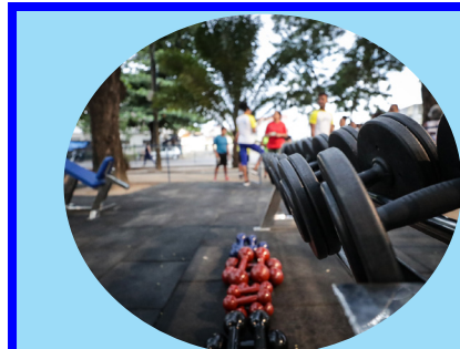
Unidades do projeto agora possuem cronograma específico para a faixa etária, durante as manhãs